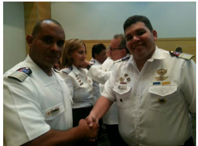
Oficiales CASMAR, reciben reconocimientos por su participación en el servicio voluntario.