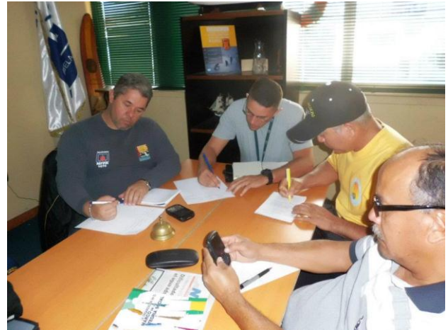
SE INICIAN PREPARATIVOS PARA LA CONSTITUCIÓN DEL ONSA/CZ PUERTO LA CRUZ

En el encuentro, se trató el tema de la necesidad de unir esfuerzos entre las diferentes organizaciones No-Gubernamentales dedicadas a las operaciones SAR, para contribuir en el área de adiestramiento y cooperación institucional.