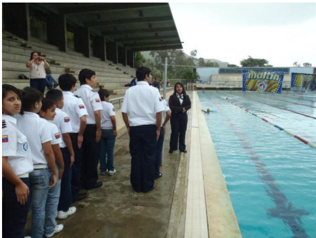
Prácticas de flotación y natación, a cargo de Oficiales de Guardavidas de la Organización.