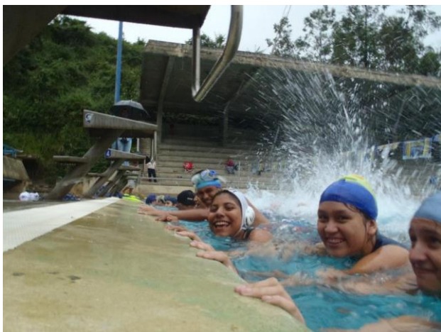
También llevan a cabo, los tradicionales Bautizos a los nuevos miembros de la Tripulación Clase.