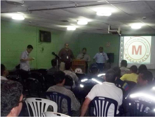
FEVESAR | REGIÓN CAPITAL SE REÚNE EN LA SEDE DE LA ONSA PARA PLANIFICACIÓN DE ACTIVIDADES

25MAR2012 | El pasado viernes 23MAR2012, la Organización Rescate Metro, convocó a un cine-foro, donde se trataba el tema de la necesaria cooperación inter-institucional que debe existir no solo entre las organizaciones particulares, sino también de los entes gubernamentales (atención primaria), para atender de manera exitosa cualquier situación de emergencia o de desastre en nuestras comunidades.