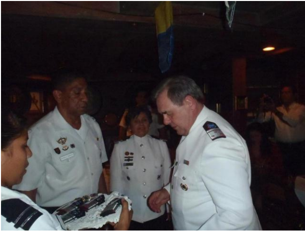
La Unidad Juvenil, también disfrutó y compartió del evento con todos los demás Oficiales.

También el Vicecomodoro Wilfredo Landaeta S., fue ascendido al rango inmediato superior de Comodoro (CASMAR); quien posteriormente le correspondió la imposición de rangos a varios Capitanes (CASMAR).