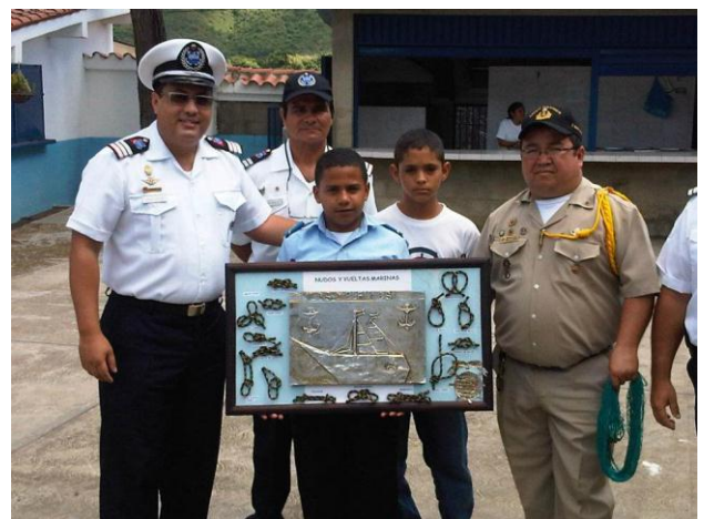
01FEB2012 | El Comandante del Componente Zonal Pampatar de la ONSA, realizó en días pasados, una serie de visitas a Escuelas e Instituciones Náuticas de la Isla de Margarita, con el objeto de promover la Seguridad Marítima y ofrecer información de carácter institucional.