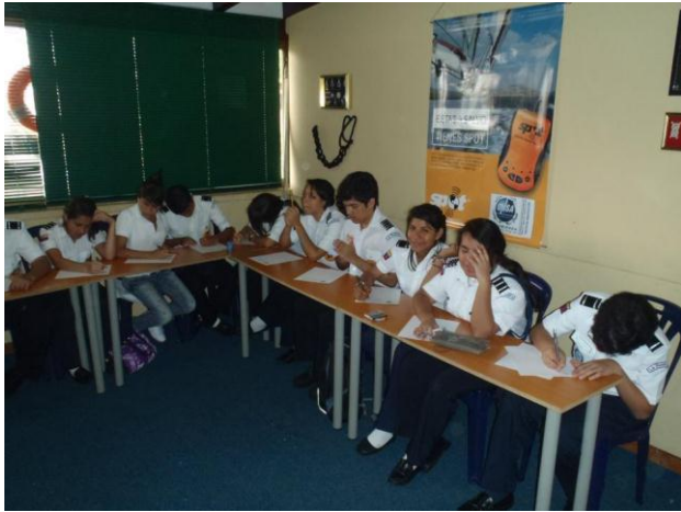
Disciplina y orden, a cargo de la Jefatura natural de sus Unidades.